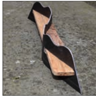
WELLENbänke Bänke zum Verweilen aus Edelstahl und Schiffsbohlen