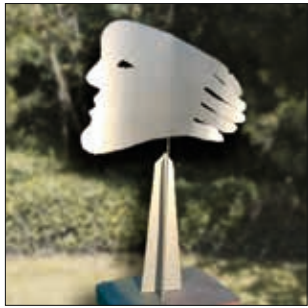
HEADhand Bewegung von Kopf und Hand aus Kunststoff im Wind als Sinnbild einer Weltachse