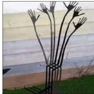
WEBstuhl Aufragende Weberhände kombiniert mit einem (Web)Stuhl

FISCHeye WEBstuhl MANOpulpo HEADhand TEXTILanker WELLENbänke OPENmind BOOOT LOVEboard