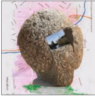
OPENmind Naturstein in Form einer Boje, mit Sichtfenster in die Landschaft und zur Ems