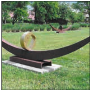
BOOOT Bootsformen aus Stahl und Beton mit beweglichen goldenen Elementen