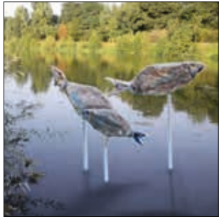
FISCHeye Dynamische Fischgruppe aus Naturstein und Keramik platziert inmitten des Emslaufes