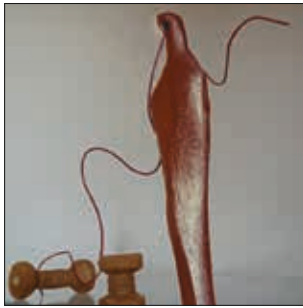
TEXTILanker Erinnerung an die Grevenor Textilindustrie durch eine Nadel mit Faden und Spulen