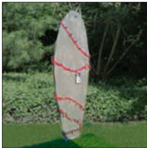
LOVEboard Aufforderung an alle Verliebten, die auf dem Emsdeich spazieren gehen